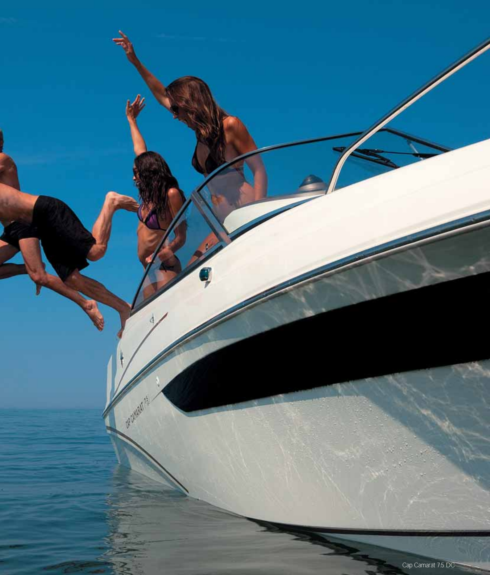
Cap Camarat 7.5 DC

Jeanneau enjoys Environmental & Quality Certification. Jeanneau bénéficie de la Certification Environnement & Qualité. Jeanneau hat das Zertifikat Umweltqualität erhalten. Jeanneau se beneficia de la Certificación Medioambiental & Calidad. Jeanneau ha ottenuto il Certificato Qualità & Ambiente.