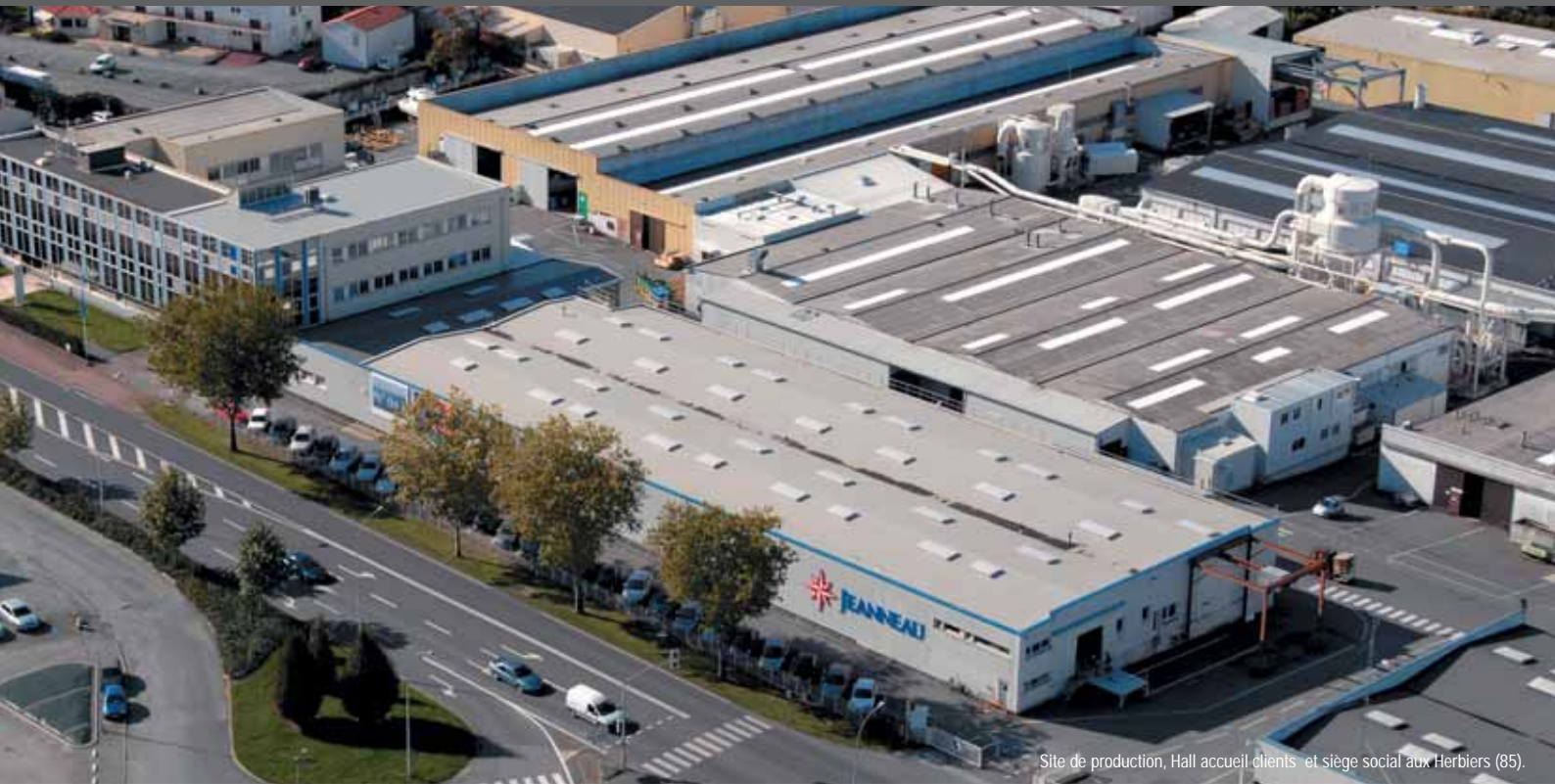
Site de production, Hall accueil clients et siège social aux Herbières (85).